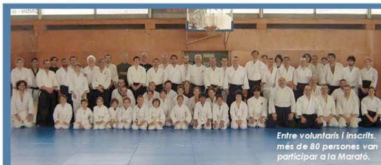
Entre voluntaris i inscrits, més de 80 persones van participar a la Marató.