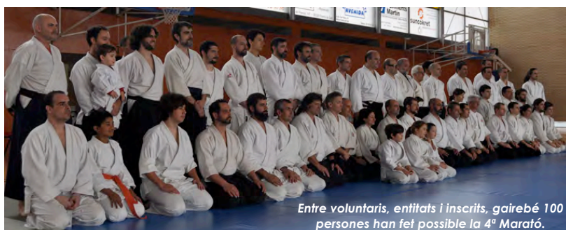
Entre voluntaris, entitats i inscrits, gairebé 100 persones han fet possible la 4 a Marató.