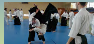
Un moment de la pràctica durant la Marató Solidària.